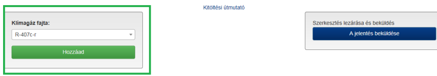
2. ábra. Klímagáz hozzáadás funkció

Gazdálkodó szervezetek klímagáz forgalmi jelentése 2015. év