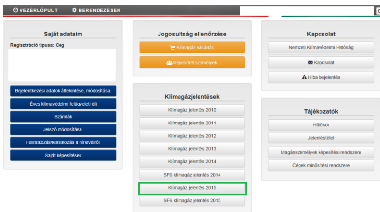
1. ábra. Jelentéstétel indítása

A hűtőközeg jelentés elkészítéséhez lépjen be Nemzeti Klímavédelmi Hatóság Klímagáz adatbázisába a https://nemzetiklimavedelmihatosag.kormany.hu/ címről. A „Vezérlőpult” menüben, a „Klímagáz jelentés 2015” fülre kattintva tudja elindítani a jelentést (1. ábra).